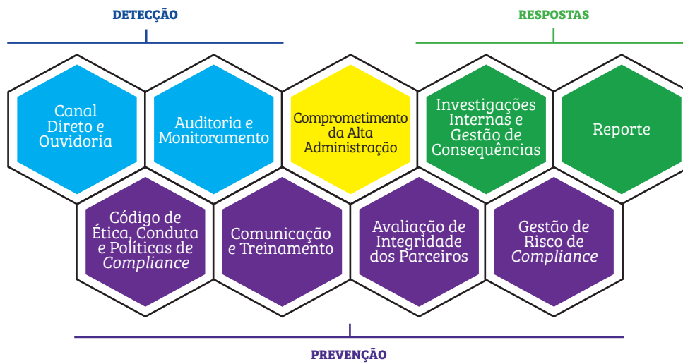
Figura 2: Pilares do Programa de Integridade

A Gerência de Compliance , dotada de autonomia, independência, imparcialidade, recursos materiais, humanos e financeiros para o pleno funcionamento, é a área responsável pelo Programa de Integridade.